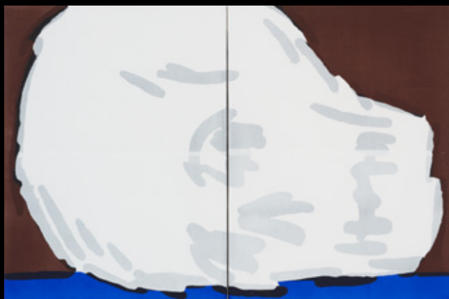
Untitled (...), 2022 akril, vászon, 40 x 60 cm