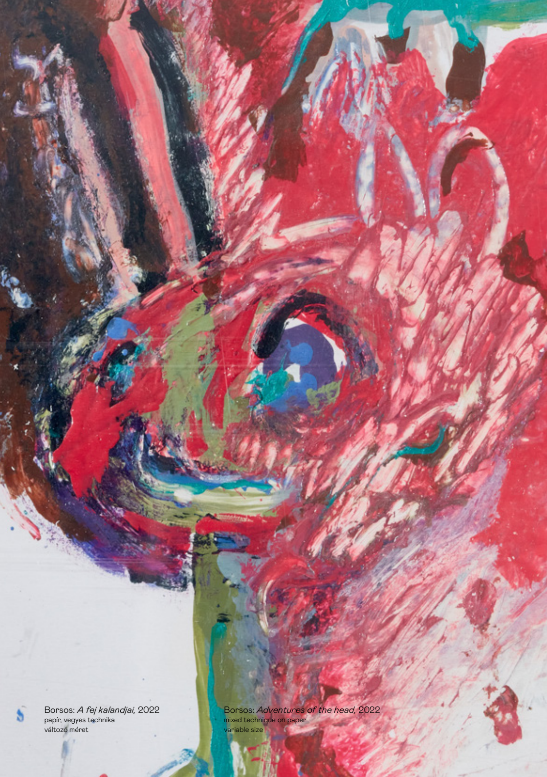
Borsos: A fej kalandjai , 2022 papír, vegyes technika változó méret