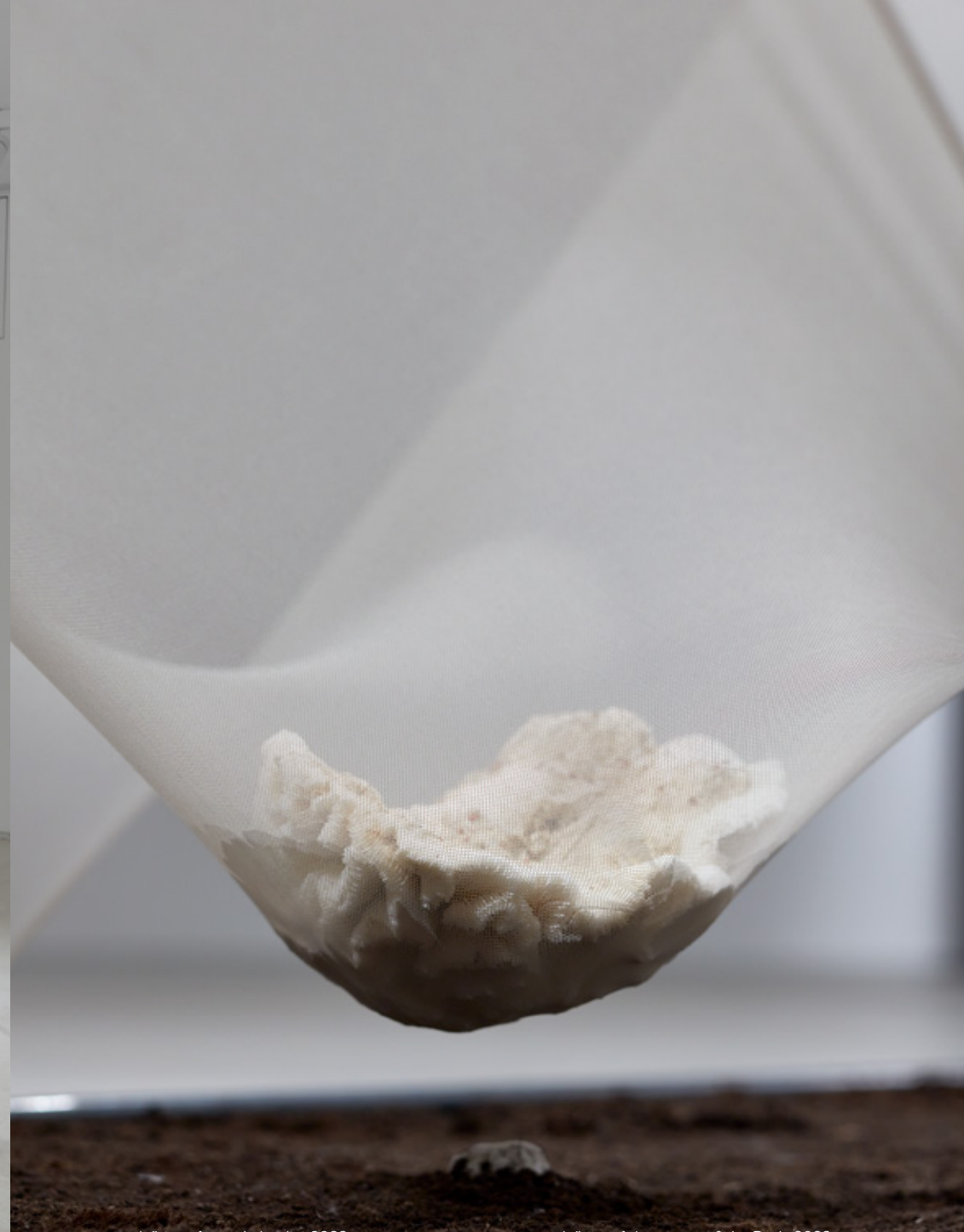
Lőrinc: Adventures of the Body , 2022 funeral paraphernalia, ritual objects, contexts of artifact as means of representing death or resurrection