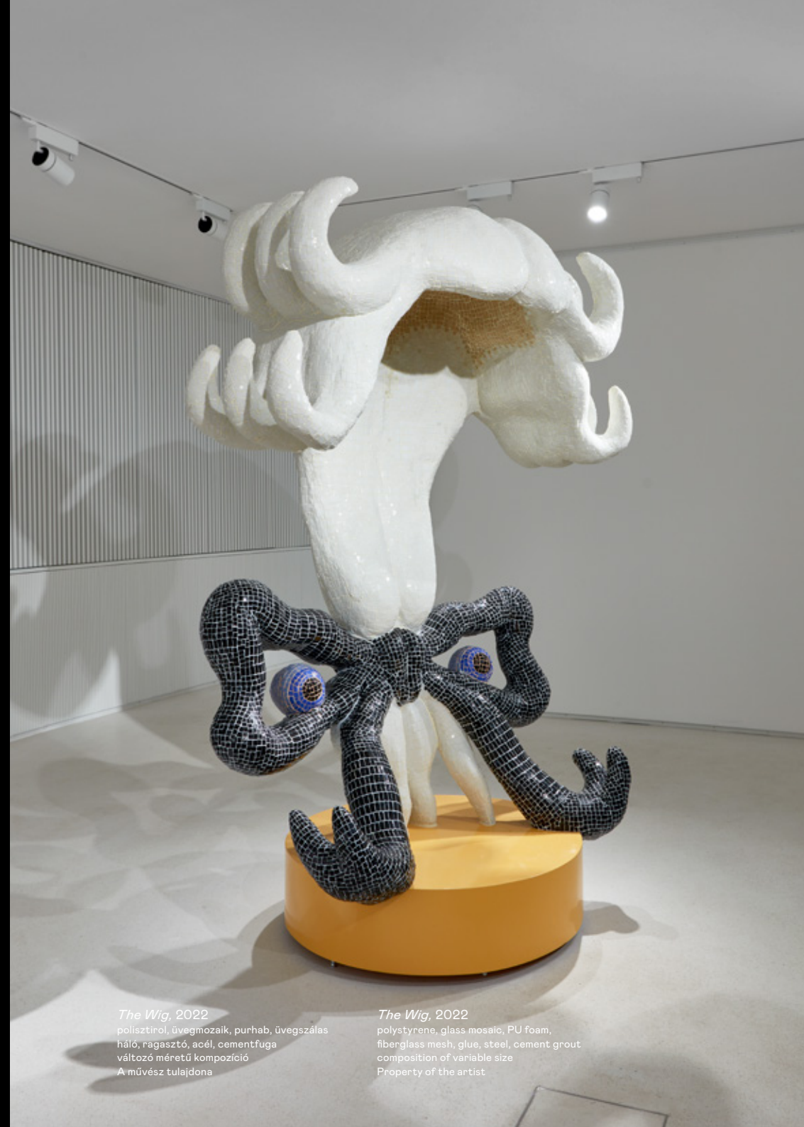
The Wig , 2022 polisztirol, üvegmozaik, purhab, üvegszálak háló, ragasztó, acél, cementfuga változó méretű kompozíció A művész tulajdona

In her art, a complex and seamless system of iconographic figures is combined with the formal language and references of the millennials. Her works may be interpreted as mosaics incarnate, combining sensuality and virtuality, analogue and digital, real and surreal, to create an archaic yet remarkably contemporary visual language that explores questions of subject's self-identity. Her work The Wig , exhibited here, is based on the story of Haydn's wig and is a reference to the surprising moment when, during the exhumation, the composer's skull was found missing from the grave, while his wig was left in the coffin as an empty symbol, without the head of the corpse. The powdered wig was originally a status symbol for aristocrats, but gradually