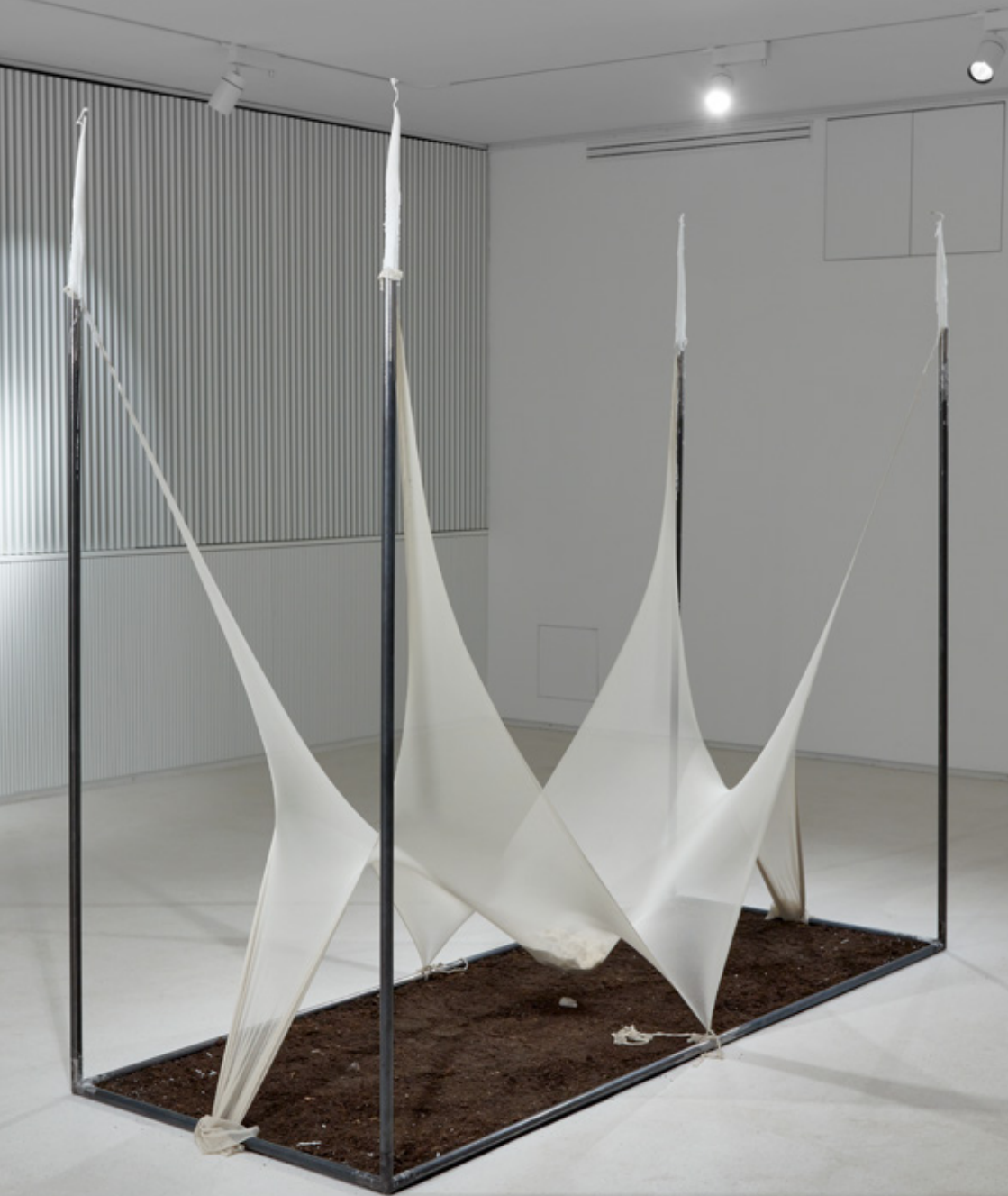
Lőrinc: A test kalandjai , 2022 temetési kellékek, rituális objektumok, műtárgykörnyezetek mint a reprezentáció halálának, vagy feltámasztásának eszközei