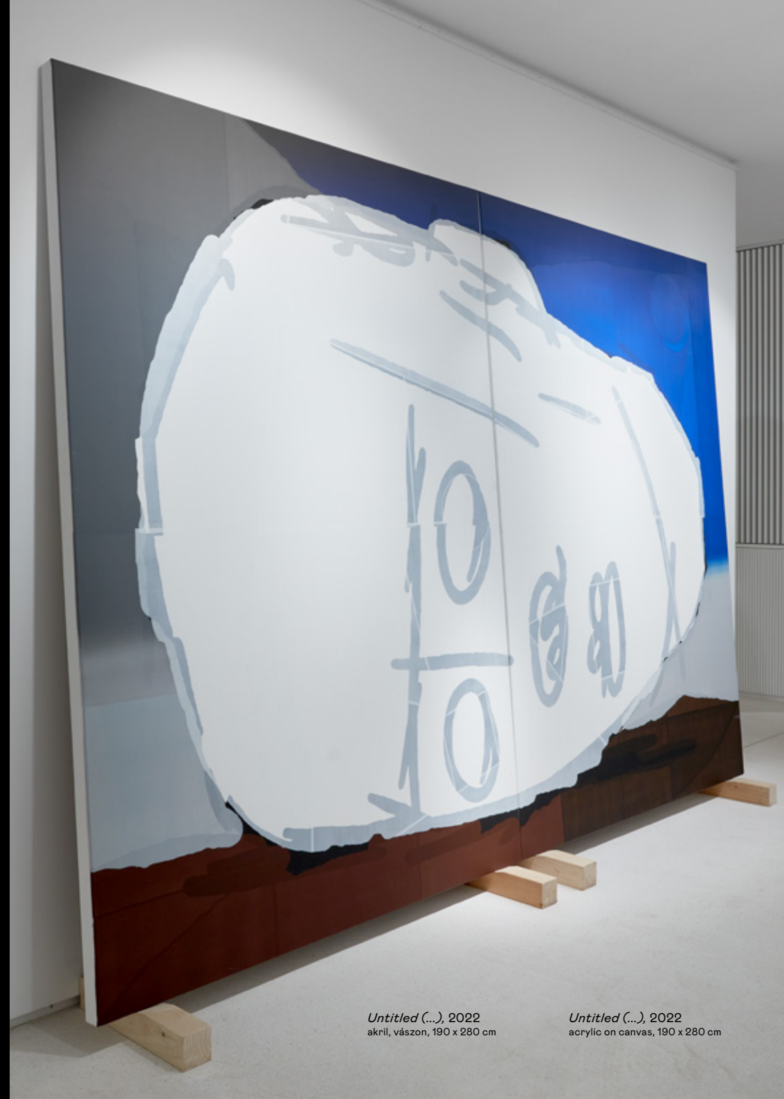
Untitled (...), 2022 akril, vászon, 190 x 280 cm

His latest works recall the historical traditions and frequently invoked motifs of still life, portrait and landscape painting. Taken out of their original contexts, the symbols are in each case reinterpreted as entirely new narratives. The atmosphere of the figures, formed with line drawings like caricatures, visually releases the tensions and melancholy of the characters and compositions depicted. Meanwhile, the titling of the