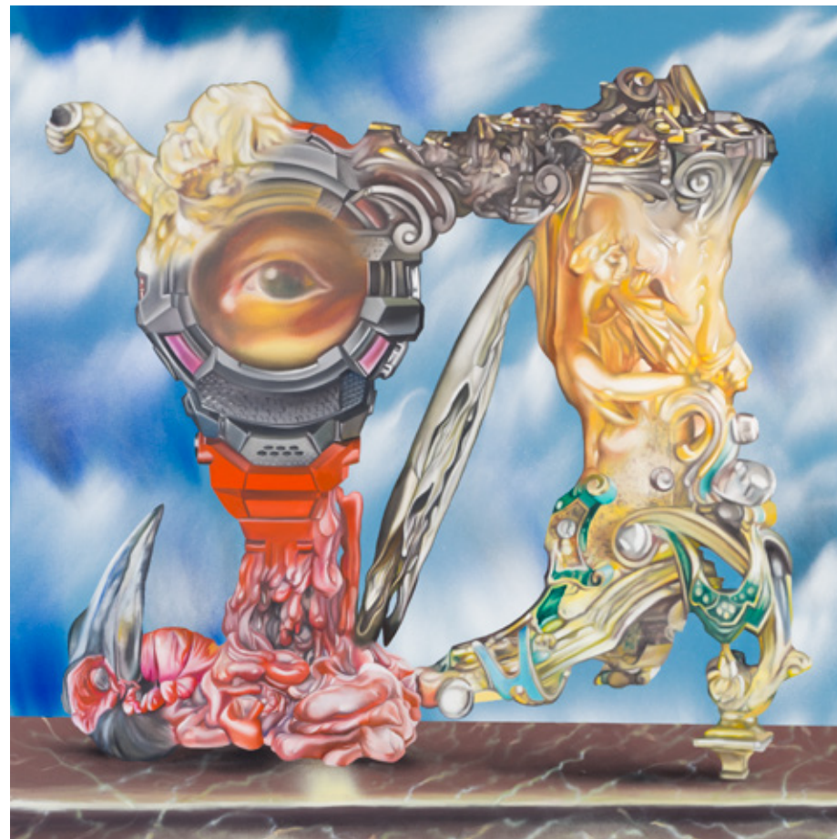
Reise um meinen Schädel 1–2, 2022 akril, vászon 120 x 120 cm (egyenként) A művész tulajdona