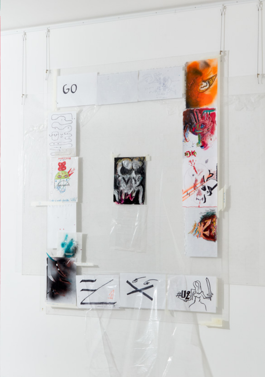
Borsos: Adventures of the head , 2022 mixed technique on paper variable size